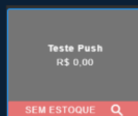
Tela do Balcão

OBS: Essa funcionalidade depende do módulo de atualização em tempo real.