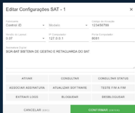
Tela da criação de um SAT pelo PDV