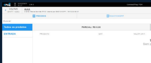
Tela da comanda com cliente Tapp

IMPORTANTE: A funcionalidade só está disponível para integração com o EASYCHOPP .